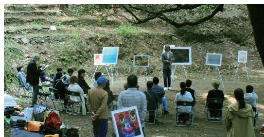
2024年3月開催 脳が脱皮する美術館 対話型アート鑑賞