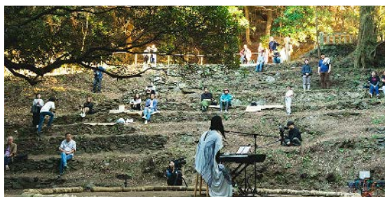
2023年11月開催 棧敷の音楽会